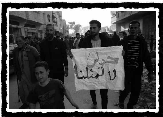
Ένας Παλαιστίνιος άνδρας κρατά ένα πανό που γράφει στα αραβικά «Η Χαμάς δεν μας αντιπροσωπεύει» κατά τη διάρκεια διαμαρτυρίας στην Μπέιτ Λαχία στις 26 Μαρτίου.