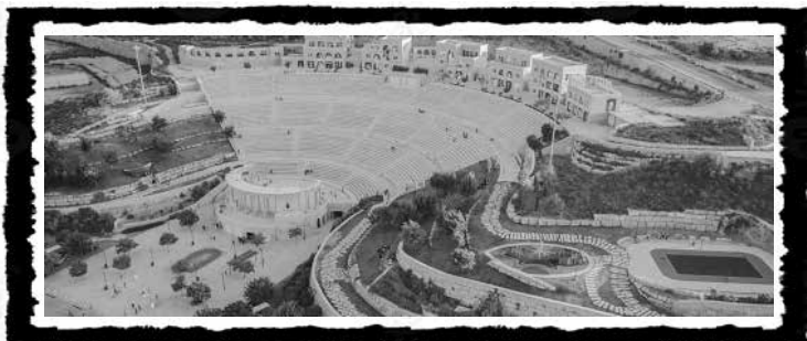
Το Rawabi-project βόρεια της Ιερουσαλήμ και της Ραμάλα, ένας παλαιστινιακής κοπής χαρπός καπιταλιστικός παιχνιδότοπος στη μέση μιας φρίκης.

Από τις κοινές αναπτυξιακές μπίζνες 78 ξεχωρίζει η σχεδιαζόμενη παλαιστινιακή πόλη του Rawabi, βορειοδυτικά της Ραμάλα, για 40.000 κατοίκους, προερχόμενος από τη μεσαία και ανώτερη τάξη Παλαιστίνιων που αντιγράφει το εποικιστικό αποικιοκρατικό pattern: μια εκ των πραγμάτων περιφραγμένη κοινότητα –δεδομένου του κατακερματισμού του εδάφους στη Δυτική Όχθη με τους ιδιωτικούς περιτοιχισμένους δρόμους και τα συνεχή checkpoints– κατασκευασμένη πάνω σε λόφο με πανομοιότυπα πολυτελή κτίρια, ζώνες κατοικίας, κατανάλωσης και εγκαταστάσεις hi-tech παραγωγής.