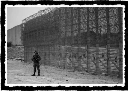
Το τείχος γύρω από τη Γάζα.

στην Παλαιστίνη καθώς και η ίδια η δημιουργία του USSC αποτελούσαν κομμάτι ενός «Οδικού Χάρτη» 84 που είχε ήδη προταθεί το 2003 προς την Παλαιστινιακή Αρχή, από ΗΠΑ κ.α., ώστε να τερματιστεί η Ιντιφάντα. Στην Ιντιφάντα πρέπει να αποδοθεί και η πολιτική επιλογή του ισραηλινού κράτους να αποσύρει από τη Λωρίδα τον στρατό και τους εποίκους, οι οποίοι ήταν πολύ λιγότεροι σε σχέση με τη Δυτική Όχθη, μόλις 6,5 χιλιάδες. Το οικονομικό κόστος για τη διατήρηση συνδυαστικά και των δύο σε μια παραδοσιακά τόσο ασταθή περιοχή ήταν ασύμφορο. Το ισραηλινό κράτος προτίμησε αντ' αυτού να εγκαταλείψει τη Γάζα, να την απομονώσει και να την αποκόψει ακόμα περισσότερο από τη Δυτική Όχθη, δυσχεραίνοντας πιο πολύ κάθε πιθανή πορεία προς μια «λύση δύο κρατών».