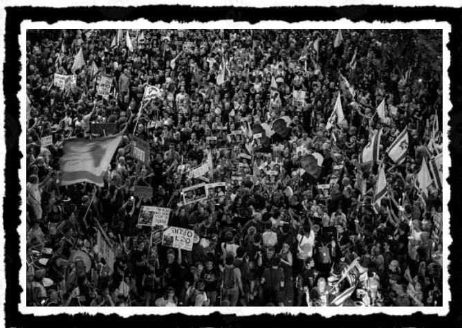
100.000 διαδηλωτές/τριες κατά του πολέμου, Τελ Αβίβ, 10 Αυγούστου 2025

Επιστρέφοντας στην αρχή της ένοπλης αντιπαράθεσης, τον Νοέμβριο του 2023, με κεντρικά συνθήματα «Εβραίοι και Άραβες αρνούμαστε να είμαστε εχθροί» και «Τερματίστε την πολιορκία της Γάζας» πραγματοποιήθηκαν πολλές αντιπολεμικές διαμαρτυρίες που είχαν διεθνιστικό περιεχόμενο με μικρό αριθμό συμμετεχόντων, οι οποίες βρέθηκαν στο στόχαστρο και της κρατικής καταστολής και ακροδεξιών ομάδων. 109 Ειδικά μετά την κατάρρευση της εκεχειρίας, αυξήθηκε σταδιακά η συμμετοχή σε αντιπολεμικές διαδηλώσεις, παραμένοντας, εντούτοις, μέχρι πρότινος μειοψηφική. Η σταδιακά αυξανόμενη κοινωνική αντίδραση στο μακελειό που η καπιταλιστική μηχανή του πολέμου έχει βάλει μπροστά στη Γάζα δεν έχει έναν σώνει και ντε ριζικά χειραφετητικό-ανατρεπτικό χαρακτήρα: η συμμετοχή των Ισραηλινών στην καμπάνια αλληλεγγύης στον παλαιστινιακό άμαχο πληθυσμό δεν σημαίνει αυτομάτως ότι έχουμε να κάνουμε με μια τάση που ξεφεύγει από τα όρια του εθνικού πλαισίου ή του δημοκρατικού-ανθρωπιστικού λόγου. Αποτελεί ένδειξη, όμως, ότι όταν και όπου ένα κομμάτι της ισραηλινής κοινωνίας καταφέρνει να διαρρήξει τον μεθοδικό επικοινωνιακό πόλεμο που διεξάγει η ισραηλινή στρατιωτική μηχανή –με το ειδικό για «information warfare» τμήμα– και έρχεται αντιμέτωπη με τη φρικτή εντατικοποίηση της απανθρωπιάς και της κτηνωδίας, η αντίδρασή της είναι να αρνηθεί να υποταχθεί σε αυτή. 110 Κι αυτή η άρνηση είναι το πρώτο βήμα σε μια διαδικασία αμφισβήτησης των εθνικών περιχαρακώσεων.