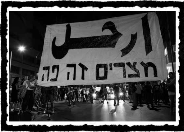
«Πάμε! (Αραβικά), η Αίγυπτος είναι εδώ!» 300.000 διαδηλωτές/τριες συμμετέχουν σε διαμαρτυρία για τις περικοπές του κοινωνικού κράτους, το αυξανόμενο κόστος ζωής και τα ακριβά ενοίκια στο φόντο της Αραβικής Άνοιξης, Τελ Αβίβ, Αύγουστος 2011.

Η αυξανόμενη κοινωνική δυσaréσκεια εκφράστηκε με ένταση στις μαζικές κοινωνικές διαμαρτυρίες του 2011 («κίνημα των σκηνών» ή «J14», από τις 14 Ιουλίου που ξεκίνησε), στον απόηχο της Αραβικής Άνοιξης, οι οποίες, για πρώτη φορά, δεν είχαν στο επίκεντρο της δημόσιας συζήτησης το διαχρονικό θέμα της (εθνικής) ασφάλειας, αλλά τις ανισότητες, την επισφάλεια και το κόστος ζωής. Στο παρελθόν είχαν αναδειχθεί κοινωνικά ή ταξικά ζητήματα υποσκελίζοντας αυτό της εθνικής ασφάλειας, για παράδειγμα, το 1971-1972, το έντονα κοινωνικό αλλά περιορισμένο εθνοτικά κίνημα των Μαύρων Πάνθηρων του Ισραήλ (Black Panthers of Israel), κίνημα που εξέφραζε τους Μιζραχί έβαζε στο επίκεντρο ζητήματα μισθού και ρατσιστικών διακρίσεων φτάνοντας μέχρι την ίδια την άρνηση του σιωνισμού.