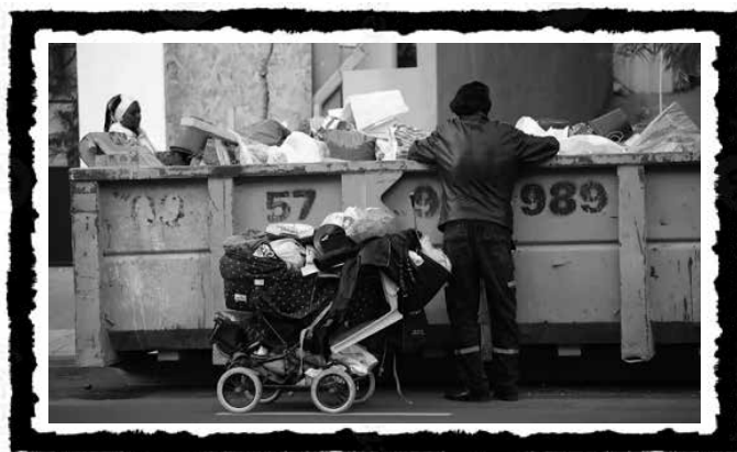
Άστεγος στο νότιο Τελ Αβιβ.

νεοφιλελεύθερου μοντέλου καπιταλιστικής διαχείρισης έχει καταστεί περισσότερο από εμφανής: τόσο το χτίσιμο του τείχους και η επιβολή αυστηρών ελέγχων μετακίνησης στους Παλαιστίνιους (με αποκρούφωμα την ανοιχτή φυλάκιση των περισσευούμενων στη Γάζα) όσο και η διαρκής υποτίμηση όλων εκείνων των πληθυσμιακών ομάδων στο Ισραήλ που βρίσκονται στις κατώτερες θέσεις της κοινωνικής ιεραρχίας (άραβες, βεδουίνοι, γυναίκες, ηλικιωμένοι, νέοι) λαμβάνουν χώρα μέσα σε μια συνθήκη μόνιμου εκβιασμού. Με τη σειρά της, η γενίκευση της πειθαρχησης και της βίας, μέχρι τις σύντομες στρατιωτικές επεμβάσεις και τις μαζικές δολοφονίες οδηγούν στη σκλήρυνση της ρατσιστικής ιεραρχίας, ανατροφοδοτούμενη με τη σειρά της από αυτήν. Ίσως το αποκρούφωμα αυτής της διαδικασίας, η οποία λαμβάνει χώρα σε ένα περιβάλλον υποχώρησης των κοινωνικών αγώνων, βρίσκει το αποκρούφωμά της στον νόμο του 2018 που επί της ουσίας επανιδρύει το Ισραηλινό κράτος ως κράτος των Εβραίων. 30