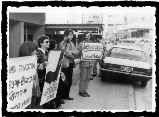
Διαδήλωση του Matzpen μπροστά από το κτίριο του Εργατικού Κόμματος στο Τελ Αβίβ, σε ένδειξη διαμαρτυρίας για τον εποικισμό στη Χεβρώνα, 12 Απριλίου 1981.

Σε ένα πρώτο επίπεδο, ταυτόχρονα με το κυνήγι του (κομμουνιστικού) εσωτερικού εχθρού και τον συνακόλουθο έλεγχο φρονημάτων, θα αποκατασταθεί η αναγκαία ρατσιστική διαστρωμάτωση της εργασιακής δύναμης που μπορεί μεν να συνοδεύει κάθε ανάπτυξη των σχέσεων κράτους και κεφαλαίου, στην περίπτωση, ωστόσο, του Ισραήλ αποτελούσε θεμελιακό τρόπο επίλυσης των χρόνιων προβλημάτων παραγωγικότητας της εργασίας. Αυτός ο τρόπος έπρεπε τώρα να ανανεωθεί, καθώς στο νέο κράτος εισρέουν εκατοντάδες χιλιάδες νέοι μετανάστες, οι οποίοι για μεγάλο διάστημα παραμένουν επιδοτούμενοι καταναλωτές κρατικών συσσιτίων και δελτίων, χρήστες υπηρεσιών υγείας και περιθαλψης, ιδιοκτήτες κατοικίας κ.α. πριν βρουν την κατάλληλη θέση στην παραγωγική διαδικασία, ώστε να αποσπαστεί η αναγκαία ποσότητα υπεραξίας από αυτούς. Από πολιτικής άποψης, αυτή η διαδικασία θα κωδικοποιηθεί στον νόμο περί ιθαγένειας του 1952, παράλληλα με την καθιέρωση κέντρων προσωρινής κράτησης για τη νεοεισερχόμενη εβραϊκή εργασιακή δύναμη και την διακριτή μεταχείριση απέναντι στους Παλαιστινίους που επιλέγουν να παραμείνουν στη χώρα, φαινομενικά, μόνο, ως αναγνωρισμένοι φορείς ισότιμων πολιτικών και κοινωνικών δικαιωμάτων.