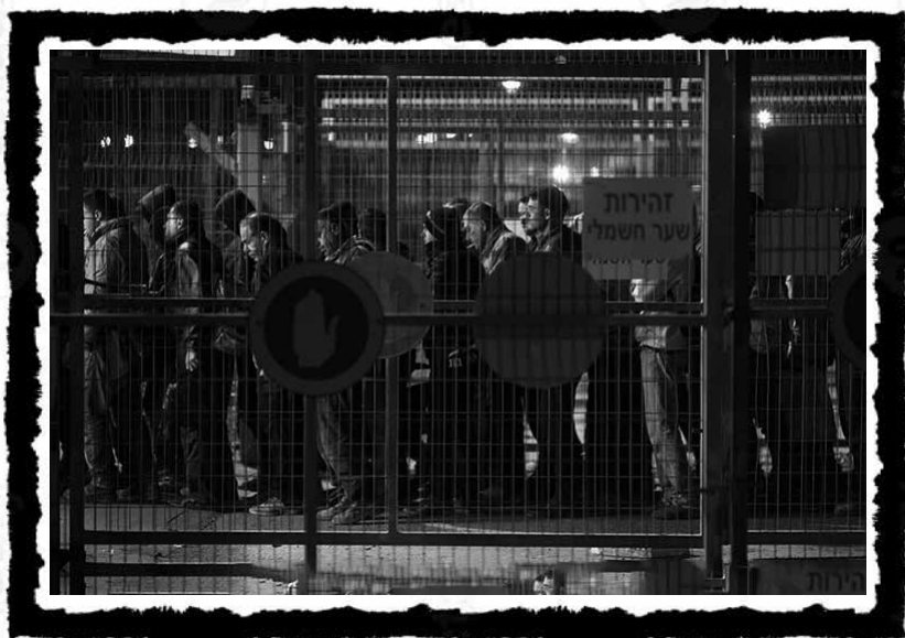
Παλαιστίνιοι/ες εργάτες/ριες φτάνουν στο πρώτο από τα οκτώ μεταλλικά καρουζέλ από τα οποία πρέπει να περάσουν στο σημείο ελέγχου Sha'ar Ephraim που χωρίζει τη Δυτική Όχθη και το Ισραήλ.

Οι φτωχοί των townships 43 συνέχισαν να επιτηρούνται και να αποκλείονται, το κυριότερο όμως είναι ότι εδώ βρίσκουμε μια τομή, καθώς το μετα-απαρτχάιντ καθεστώς παράγει πλεονασματικό πληθυσμό σε κλίμακα που δεν υπήρχε στο «κλασικό» απαρτχάιντ. Η σχέση κεφαλαίου-εργασίας αλλάζει από το πρότερο καθεστώς υπο-ενσωμάτωσης σε καθεστώς περιττότητας και περιθωριοποίησης, όχι μέσω ρατσιστικής νομοθεσίας, αλλά μέσω της αναπαραγωγής της κυριαρχίας του κεφαλαίου επί των μέσων ζωής και εργασίας, με τη σχετικοποιημένη πια φυλετικοποίηση να συντηρείται από τους «νόμους της αγοράς».