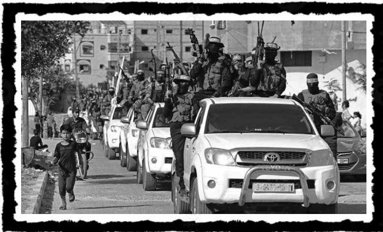
2007, η Χαμάς καταλαμβάνει την εξουσία στη Γάζα. Τα μέλη της αλ-Κασάμ, του στρατιωτικού τμήματος της Χαμάς, πραγματοποιούν παρέλαση στη Ράφα.

Αν και η Χαμάς δημιουργήθηκε σχεδόν ταυτόχρονα (Φεβρουάριο 1988) με την Πρώτη Ιντιφάντα, η Φατάχ και συνολικά η ΟΑΠ βγήκαν οι μεγάλοι κερδισμένοι, διότι σταδιακά κατάφεραν να καβαλήσουν το άρμα της εξέγερσης. Έλεγξαν, αφομοίωσαν, στρατιωτικοποίησαν και εθνικοποίησαν τον κοινωνικό αγώνα. Αυτή η συνθήκη επέτρεψε στην ΟΑΠ να μεταφερθεί για πρώτη φορά στο τραπέζι των διαπραγματεύσεων με το Ισραήλ και να υπογραφούν οι συνθήκες του Όσλο, το 1993-95, που οδήγησαν στη δημιουργία της Παλαιστινιακής Αρχής, με την ΟΑΠ στα ηνία. Η Χαμάς αρνήθηκε τον συμβιβασμό αυτών των ειρηνευτικών διαδικασιών· επέμεινε στη ρητορική εναντίωση απέναντι στο δικαίωμα ύπαρξης κράτους του Ισραήλ και στο δόγμα της για απόσυρση των κατοχικών δυνάμεων. Ενώ η ΟΑΠ αποσύρεται από τον ένοπλο αγώνα ενάντια στο Ισραήλ, η Χαμάς συνεχίζει τις σχετικές επιθέσεις. Οι ΗΠΑ ανακηρύσσουν τη Χαμάς τρομοκρατική οργάνωση και η ηγεσία της εξορίζεται από την Ιορδανία με την αλλαγή του εκεί καθεστώτος το 1999 και εγκαθίσταται στη Δαμασκό της Συρίας. 95 Το Ισραήλ βέβαια είχε καθυστερήσει χαρακτηριστικά την κήρυξη της Χαμάς ως «παράνομη» έως το φθινόπωρο του 1989, δηλαδή έναν χρόνο μετά τη διάλυση των λαϊκών επιτροπών της ΟΑΠ – γεγονός που καταδεικνύει την de facto ανοχή που είχε μέχρι τότε το ισλαμιστικό στρατόπεδο. 96