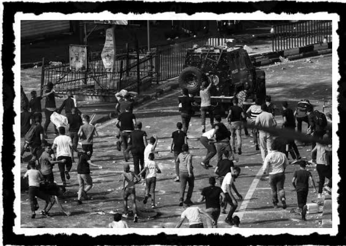
Συγκρούσεις παλαιστίνιων διαδηλωτών με τις παλαιστινιακές δυνάμεις ασφαλείας, στη Ναμπλούς στη Δυτική Όχθη, 2022.

Την επαύριο κιόλας της Δεύτερης Ιντιφάντα (2005), αμερικανοί ειδικοί του στρατού και της αστυνομίας καταφθάνουν στην Παλαιστίνη, στο πλαίσιο της χρηματοδότησης του πρώτου από τα Προγράμματα Δομικής Προσαρμογής που υπογράφηκαν από την Παλαιστινιακή Αρχή των Αμπάς-Φαγιάντ, για να εκπαιδεύσουν σε ιορδανικά στρατόπεδα τις παλαιστινιακές δυνάμεις ασφαλείας και να συντονίσουν τη συνεργασία τους με τον ισραηλινό στρατό –που έκτοτε συνηχίζεται με μικρότερες ή μεγαλύτερες εντάσεις– για την επιβολή της τάξης και της ασφάλειας εντός των θυλάκων. Ο συντονισμός των δυνάμεων ασφαλείας Ισραήλ-Παλαιστίνης επαινείται τόσο από αξιωματούχους των ΗΠΑ όσο και από Ισραηλινούς. Σύμφωνα με υψηλόβαθμους ισραηλινούς αξιωματικούς: «Αυτή είναι η μόνη πτυχή της ειρηνευτικής διαδικασίας που λειτουργεί καλά. Δεν υπάρχει τίποτα άλλο. Θα πρέπει να ενθαρρυνθεί».