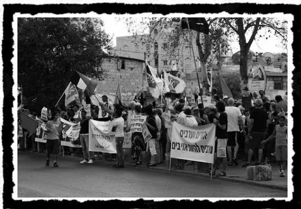
Εβραίοι και Παλαιστίνιοι στη λεγόμενη «Μάχη της Sheikh Jarrah», ενάντια στις εξώσεις στην Ανατολική Ιερουσαλήμ, Αύγουστος 2010.

για αστική αναδιάρθρωση μέσω φυλετικής/ταξικής εκκαθάρισης ξεπήδησε ένα αυτόνομο προλεταριακό κίνημα από παλαιστίνιους νέους οργανωμένους σε επιτροπές γειτονιάς και συλλογικότητες βάσης. Επιθέσεις και κινήσεις αλληλεγγύης εμφανίστηκαν στη Δυτική Όχθη, τη Γάζα και τις μικτές πόλεις εντός Ισραήλ (Λοντ, Χάιφα), με τη συμμετοχή χιλιάδων σε καθολική απεργία στις 18 Μαΐου. Επρόκειτο για μια πολυκεντρική διαταξική κοινωνική κινητοποίηση με αντιεραρχικά χαρακτηριστικά και με ισχυρή παρουσία νεολαίων, γυναικών και συλλογικοτήτων βάσης.