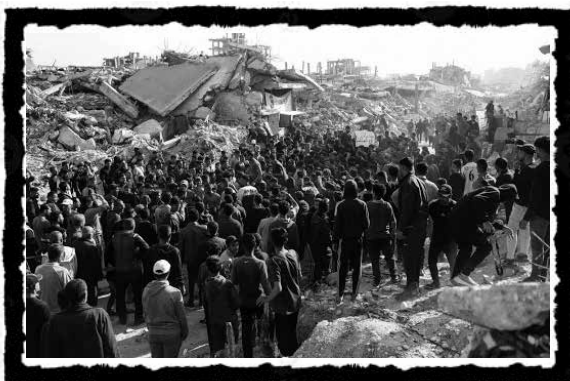
Παλαιστίνιοι απαιτούν τον τερματισμό του πολέμου, φωνάζοντας συνθήματα κατά της Χαμάς, στην Μπέιτ Λαχία στις 26 Μαρτίου.

το καλοκαίρι του 2023 και το πιο εντυπωσιακό, εν καιρώ πολέμου την άνοιξη του 2025. Το σύνθημα «Θέλουμε να ζήσουμε!» (Bidna n'eesh) εμφανίστηκε για πρώτη φορά, το 2019, ως κραυγή απέναντι στη φτώχεια, την ανεργία, τον πληθωρισμό και την αυταρχική διαχείριση της καθημερινής ζωής. 133 Η Χαμάς απάντησε με συλλήψεις, βασανισμούς και αποκλεισμό των εξεγερμένων περιοχών. Οι κοινωνικές κινητοποιήσεις αυτών των χρόνων είχαν εν πολλοίς φιλελεύθερο και δημοκρατικό χαρακτήρα, εκφράζοντας μια αυθεντική ανάγκη για πολιτικές και ατομικές ελευθερίες, διαφάνεια και κοινωνική δικαιοσύνη. Αυτό που τις καθιστά ριζοσπαστικές είναι ότι αναδεικνύουν τη διπλή υποτέλεια που βιώνει το προλεταριάτο της Γάζας: από τη μία, την υλική και βιοπολιτική καταπίεση του ισραηλινού κράτους· από την άλλη, τη θεσμική καταστολή και την αυταρχική διακυβέρνηση της Χαμάς. Εκφράζουν την αγανάκτηση μιας κοινωνίας που βιώνει τη συνθήκη του «πλεονάζοντος προλεταριάτου» – εργαζόμενοι χωρίς εργασία, νέοι χωρίς μέλλον, πληθυσμός υπό καθεστώς επιβίωσης.