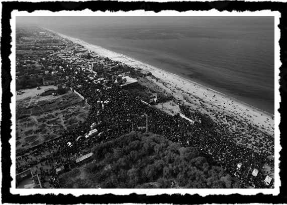
Χιλιάδες εκτοπισμένοι/ες Παλαιστίνιοι/ες περιμένουν μετά την υπογραφή της εκεχειρίας, τον Ιανουάριο του 2025, να τους επιτραπεί να ξαναγυρίσουν στη Βόρεια Γάζα.

Στο πλαίσιο αυτής της ανάγνωσης, η τρέχουσα σφαγή σηματοδοτεί μια καμπή στην εξέλιξη της αστικής δημοκρατίας γενικότερα, και όχι μόνο της ισραηλινής: την αφομοίωση μιας μόνιμης κατάστασης «έκτακτης ανάγκης» ως της μόνης δυνατής οδού διαφυγής για έναν καπιταλισμό που βρίσκεται σε συνεχή σύγκρουση με τις οξυμένες αντιφάσεις του. Η παραδειγματική στρατιωτική διαχείριση της Γάζας δημιουργεί τη ζοφερή πιθανότητα ενός τέτοιου μέλλοντος για όλους τους «πλεονάζοντες».