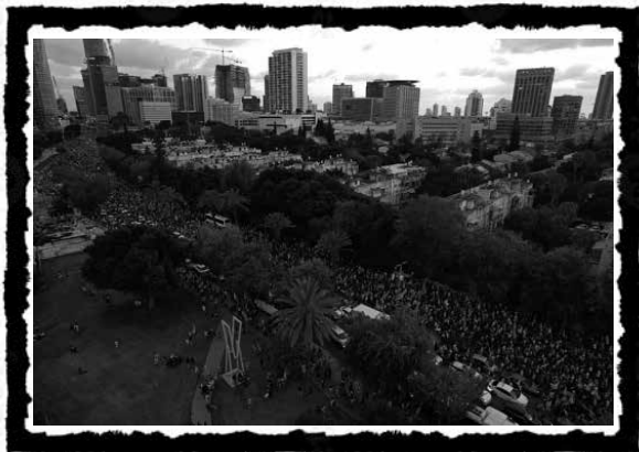
1.000.000 διαδηλωτές/τριες στη γενική απεργία κατά της επιμήκυνσης του πολέμου και της εισβολής και παραμονής του στρατού στην πόλη της Γάζας, Τελ Αβίβ 17 Αυγούστου 2025