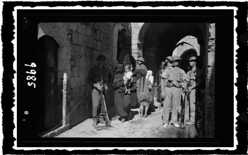
Η Ιερουσαλήμ στην περίοδο της Βρετανικής Εντολής.