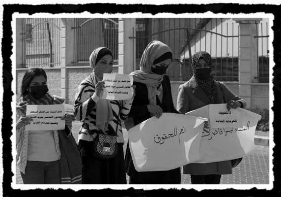
Γυναίκες διαμαρτύρονται στην πόλη της Γάζας κατά της απόφασης του Δικαστικού Συμβουλίου της Σαρία που απαγορεύει στις ανύπαντρες γυναίκες να κυκλοφορούν μέσα και έξω από τη Λωρίδα της Γάζας χωρίς την άδεια του «κηδεμόνα» τους, που συνήθως θεωρείται ο πατέρας τους ή κάποιος μεγαλύτερος άνδρας συγγενής, 2021.

τη ριζοσπαστική πολιτικοποίηση του παλαιστινιακού προλεταριάτου, ενώ η Γάζα μετατράπηκε συν τω χρόνω σε εργαστήρι του παλαιστινιακού εμφυλίου . Η εμφάνιση της Παλαιστινιακής Μουσουλμανικής Αδελφότητας ως «πολιτιστικού» κινήματος με στόχο την κατασκευή του «ισλαμικού ατόμου», 91 με έμφαση στην ηθική καθαρότητα και την αποχή τόσο από την ταξική πάλη όσο και από την ένοπλη αντιπαράθεση με το ισραηλινό κράτος, τοποθέτησε το ισλαμιστικό κίνημα σε ανταγωνιστική σχέση με τον εκκοσμικευμένο εθνικισμό της ΟΑΠ. Ακόμα και στην Πρώτη Ιντιφάντα όπου η Χαμάς συμμετέχει με σχετική καθυστέρηση και αφού πιέζεται από τη «λαϊκή νομιμοποίηση της αντίστασης» διατηρείται η πολιτισμική ατζέντα της Μουσουλμανικής Αδελφότητας με επιθέσεις σε «μη-ισλαμικές» συμπεριφορές, τη βίαιη επιβολή του χιτζάμπ στις γυναίκες στη Γάζα ως σημάδι «σεμνότητας και εθνικής ευπρέπειας» και ρητορικές περί «θεϊκά εγκεκριμένου, ηθικά καθαρού και πολιτισμικά ενάρτερου εθνικού αγώνα». 92