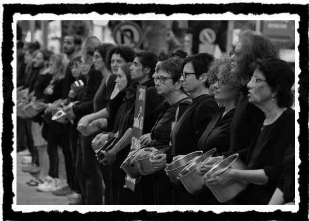
Διαμαρτυρίες στο Τελ-Αβίβ ενάντια στην επιβολή λιμού ως όπλο πολέμου στον πληθυσμό της Γάζας.

τον αστικό κοινοβουλευτισμό σε αντιπαράθεση με τη φεουδαρχική και απολυταρχική εξουσία. Τουλάχιστον από τις αρχές του 20ού αιώνα και μετά, ο σχηματισμός νέων εθνικών κρατών χρησιμεύει μόνο για να δικαιολογηθούν οι βάνουσες εθνοκαθάρσεις, οι μαζικές εκτοπίσεις πληθυσμών και οι συστηματικές διακρίσεις κατά των μειονοτήτων. Στα τέλη της δεκαετίας του 1940, ταυτόχρονα με τον σχηματισμό του σιωνιστικού κράτους –και επίσης ως συνέπεια της διπλής διαπραγμάτευσης του βρετανικού ιμπεριαλισμού– έλαβε χώρα η εξαναγκαστική μαζική έξοδος μουσουλμάνων από την Ινδία και ινδουιστών από το Πακιστάν, που προκλήθηκε από φρικτά πογκρόμ και στις δύο πλευρές. Η διάλυση της Γιουγκοσλαβίας, πιο πρόσφατα, οδήγησε σε αιματηρούς εμφυλίους πολέμους και σφαγές. Η ισραηλινο-παλαιστινιακή σύγκρουση, με τις σφαγές και τους πρόσφυγες, ενώ έχει τις ιδιαίτερες πτυχές της, δεν είναι ένα εξαιρετικό κακό, αλλά, δυστυχώς, ένα κλασικό προϊόν της τρέχουσας καπιταλιστικής περιόδου. Η ιστορία της αντιπαράθεσης μεταξύ της εβραϊκής και της αραβικής αστικής τάξης στην Παλαιστίνη καταδεικνύει πώς τα «εθνικά» κινήματα τόσο των εβραίων, όσο και των αράβων, αν και γεννήθηκαν από την οδυνηρή εμπειρία της καταπίεσης και των διωγμών, είναι άρρηκτα συνυφασμένα με την αντιπαράθεση των αντίπαλων ιμπεριαλισμών και πώς αυτά τα κινήματα έχουν χρησιμοποιηθεί για να επισκιάσουν τα κοινά ταξικά συμφέροντα των αράβων και εβραίων προλετάρων, οδηγώντας τους να σφαγιάζονται μεταξύ τους για τα συμφέροντα των εκμεταλλευτών τους.