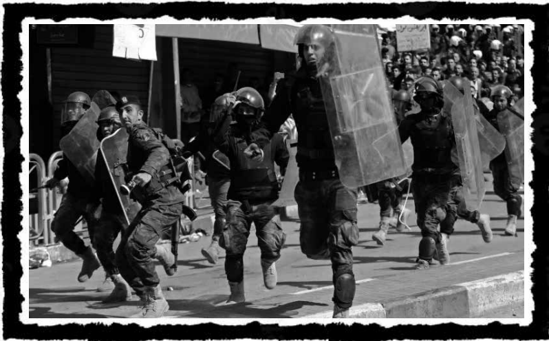
Ματατζήδες της Παλαιστινιακής Αρχής επί τω έργω... Από διαδήλωση στη Χεβρώνα τον Φλεβάρη του 2017

Η απάντηση του κεφαλαίου στα κινήματα που ξεσπάζει σήμερα στη Μέση Ανατολή, στη Δύση και σε όλο τον κόσμο περνάει μέσα από την αναζωπύρωση και την κλιμάκωση του πολέμου, την επένδυση στην ανασφάλεια και την ευρεία στρατιωτικοποίηση της κοινωνίας. Η αντίφαση μεταξύ περιττότητας και αναγκαιότητας του προλεταριάτου ξαναμπάνει σε πρώτο πλάνο και τα όρια ρευστοποιούνται περαιτέρω. Το ζήτημα της εθνικοποίησης των αγώνων τίθεται όλο και πιο επιτακτικά, με νέες και παλιές μορφές, προσαρμοσμένες στην όλο και βαθύτερη κρίση. Οι προλεταριακοί αγώνες, το πραγματικό περιεχόμενο της κρίσης που μαίνεται, χρειάζονται την έμπρακτη κριτική της εθνικοποίησης που μόνο οι ίδιοι μπορούν να ασκήσουν, την επαναστατική ανακάλυψη υλικών μορφών οργάνωσης, την υπέρβαση των διαχωρισμών και των καπιταλιστικών κοινωνικών σχέσεων στην ολότητά τους.