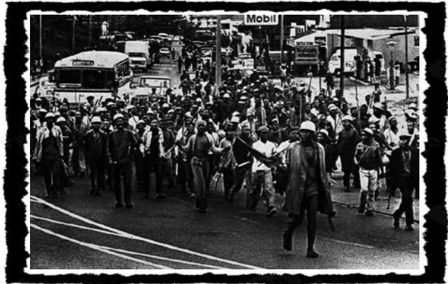
Διαδήλωση εργατών της Coronation Brick Company στο Durban, το 1973, από τις πιο δυναμικές άγριες απεργίες της περιόδου.

ενάντια στην υποχρεωτική διδασκαλία των Afrikaans και εξελίχθηκε σε άγρια συμπλοκή με οδοφράγματα και πυρπολήσεις κρατικών στόχων, με τη συνδρομή των εργατ(ρι)ών που επέστρεφαν εκείνη την ώρα από τα εργοστάσια. Τις επόμενες ημέρες ο αγώνας επεκτάθηκε στα townships γύρω από το Γιοχάνεσμπουργκ και σε άλλες περιοχές, με απεργίες, διαδηλώσεις και συγκρούσεις. Οι πολιτικές οργανώσεις είχαν μικρό ρόλο. Το ANC παρενέβη περιορισμένα στη λήξη της εξέγερσης, ενώ την πολιτική ηγεμονία εκείνη τη στιγμή εξέφρασε το Black Consciousness Movement, που τόνιζε την αυτενέργεια των μαύρων χωρίς προσφυγή στους λευκούς θεσμούς. Ως ρεύμα, λειτούργησε ως ριζοσπαστικός εθνικισμός ταυτότητας: ανέδειξε αξιοπρέπεια και αυτοοργάνωση, αλλά, θέτοντας την ταξική πάλη σε δεύτερη μοίρα, δεν παρήγαγε υλικό σχέδιο σύγκρουσης στους χώρους εργασίας και δεν ξεπέρασε κοινωνικά τα όρια φοιτητών και μεσαίων στρωμάτων.